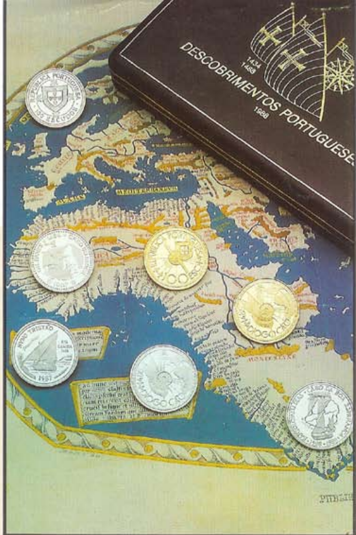
SÉRIE I (1987-1988): À Descoberta da África

A SÉRIE I foi emitida em 1987/1988 por ocasião das comemorações dos 500 anos da descoberta do Cabo da Boa Esperança e da passagem marítima para o Índico, por Bartolomeu Dias em 1488.